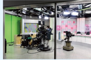
情報センターデスクからのガラス越しの様子

ニューススタジオとして使用しています。 スタジオの情報センター側の壁面はガラス張りで、フロアを一体的に運用できるようになっています。 スタジオ内のスタッフとデスクのスタッフがアイコンタクトなどで、容易にコミュニケーションを取れるところが特徴です。