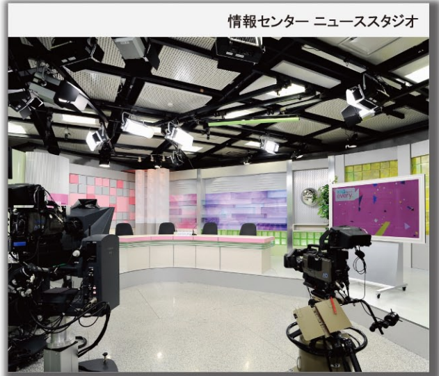
情報センター ニューススタジオ

所在地：富山県富山市牛島町10番18号 スタジオ広さ：約144㎡ スタジオ高さ：3.5m 照明更新工事：東芝エルティーエンジニアリング（株） 照明更新完成：平成24年11月