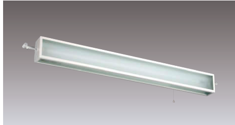
直管形LEDベースライト 非常用照明器具 センサー付階段灯 LEDTS-41863YK-LS9