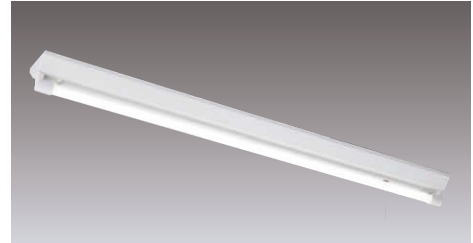
直管形LEDベースライト 非常用照明器具 逆富士器具 LEDTS-41307N-LS9