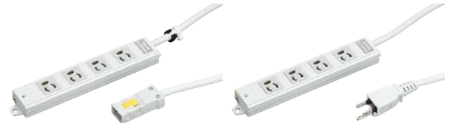
ハーネス用OAタップ (4コ口抜け止め形) 「DC8124EN-3」「DC8124EN-5」