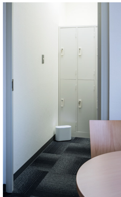
⑤更衣室 脱臭機能があり、コンパクトなため、持ち運んで使うことが可能

空気清浄機は、ホコリやニオイ、花粉、菌をフィルターにて取り除くことに対し、UVishは、深紫外線 UV-C照射による空気除菌に特化していることに注目されました。