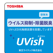
“UVish設置”ポップシール

特に、警備員は集団行動が多く、一人が感染するとクラスターを発生させる可能性も想定されるため、その防止策として、長時間常駐する共用空間の空気除菌の強化を検討されていました。