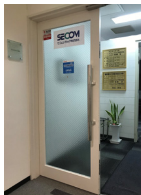
②本社入口の扉に貼られた「UVish設置」のポップシール